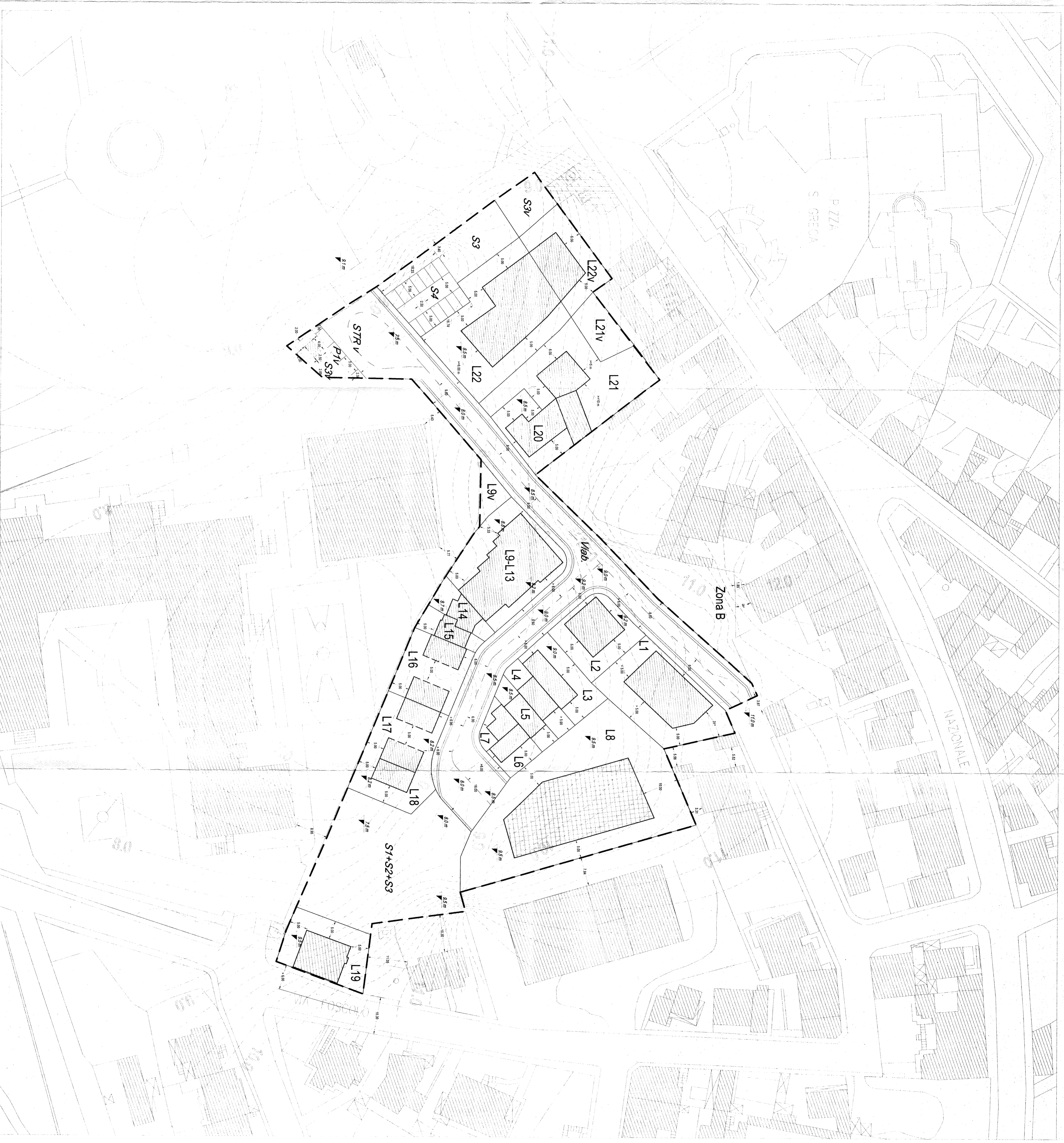
TABELLE LOTTI "VARIANTE SOSTANZIALE"