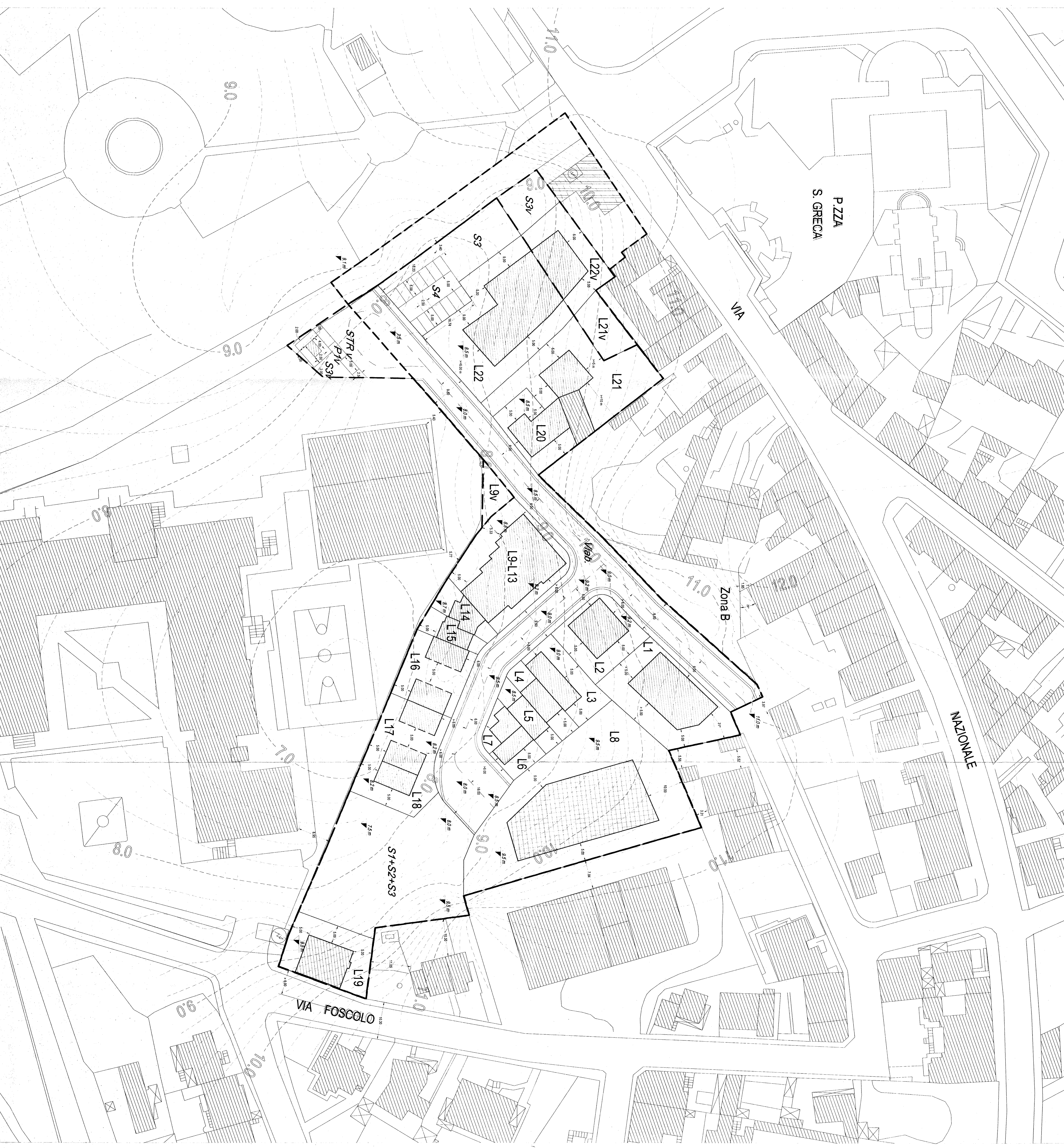
TABELLE LOTTI "VARIANTE SOSTANZIALE"