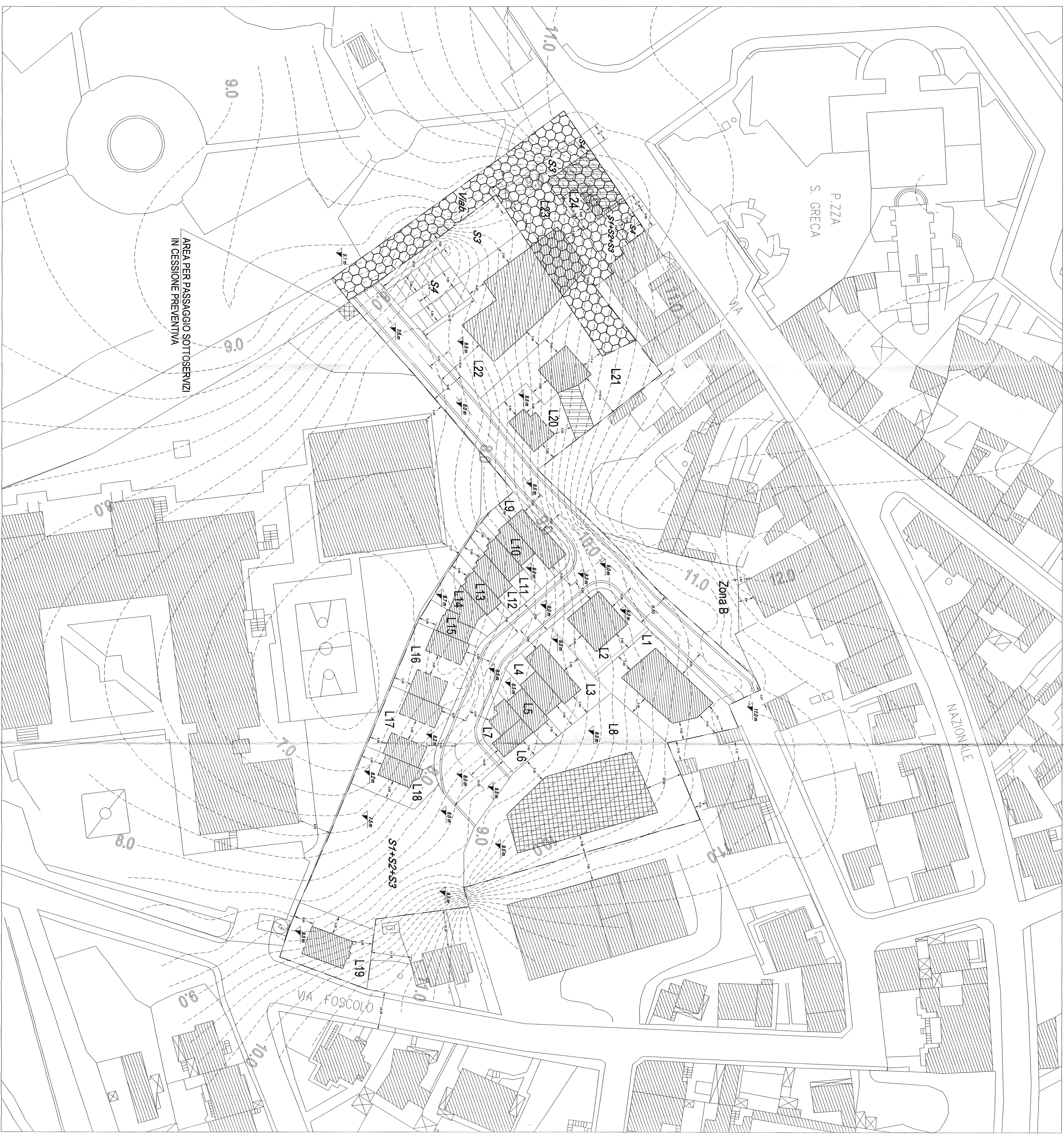
TABELLE LOTTI "PROGETTO APPROVATO" COMPARTO "A" (OGGETTO DELL'INTERVENTO)