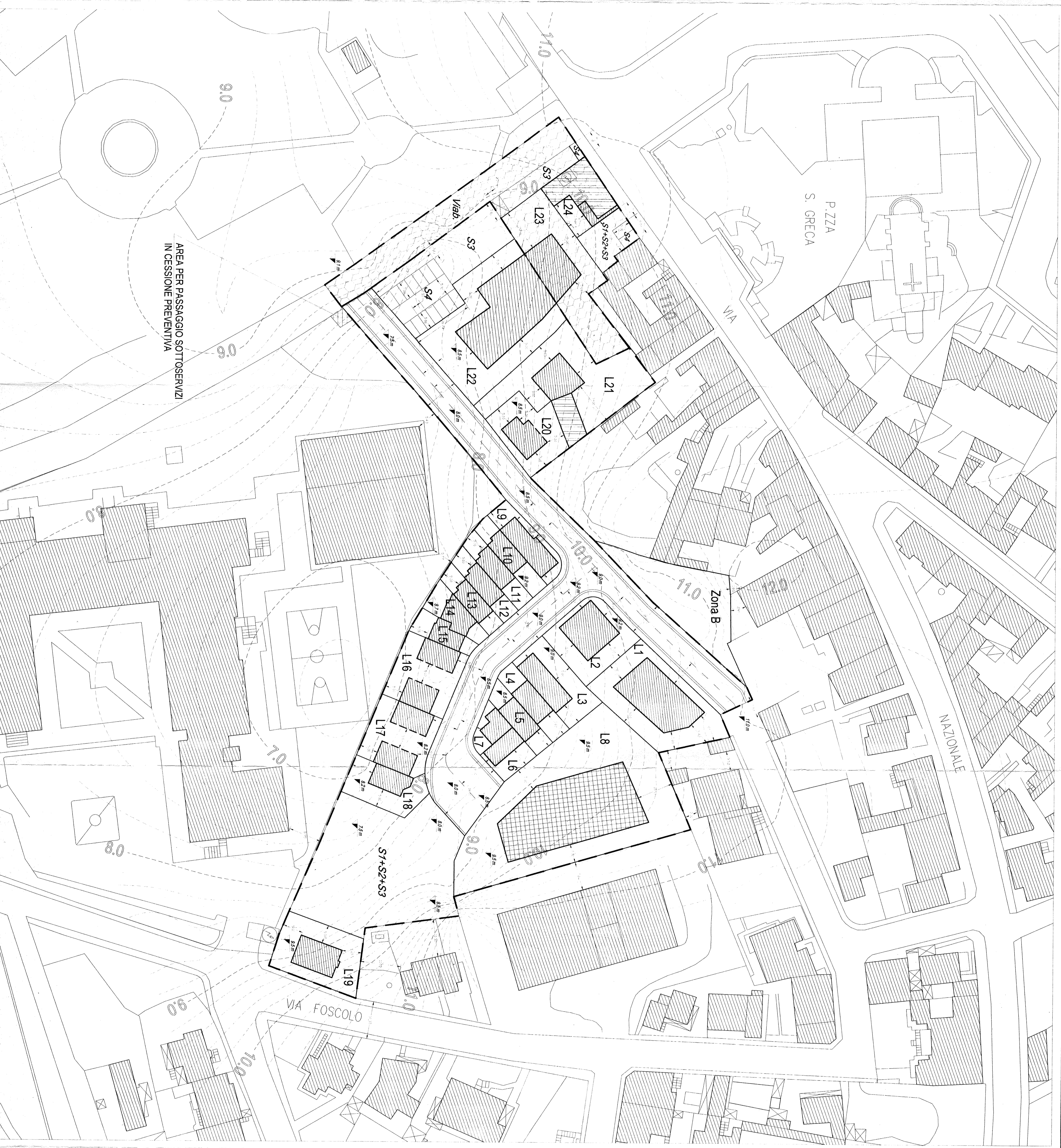
TABELLE LOTTI COMPARTO "A" (OGGETTO DELL'INTERVENTO)