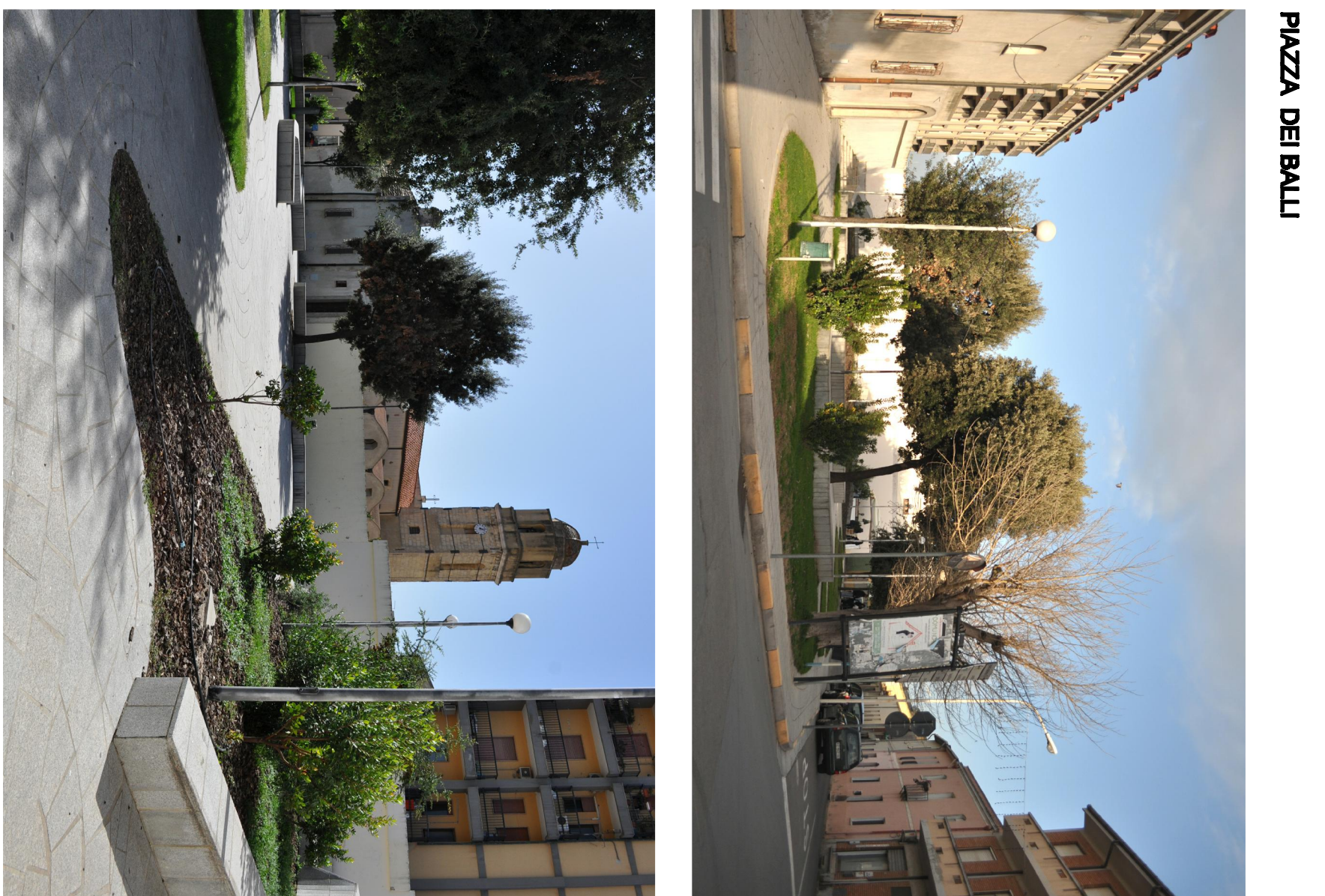
PIAZZA DEI BALII